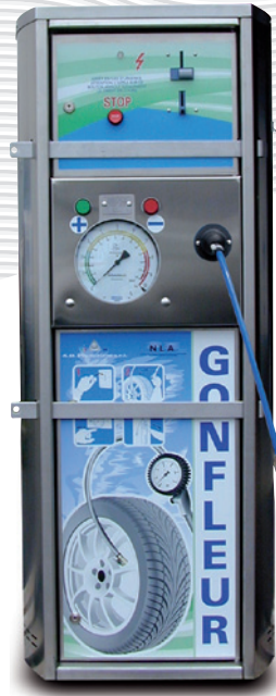
PE913025 avec tuyau à enrouleur