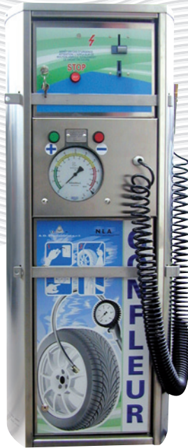
PE913015 avec tuyau externe

Un classique indispensable avec plusieurs variantes adaptées à tous les besoins